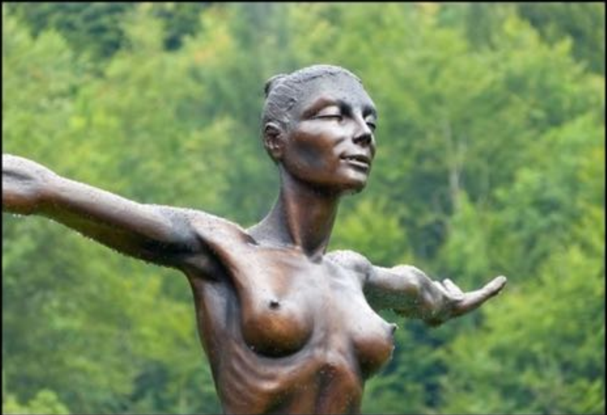
Grande Fluide (2005)