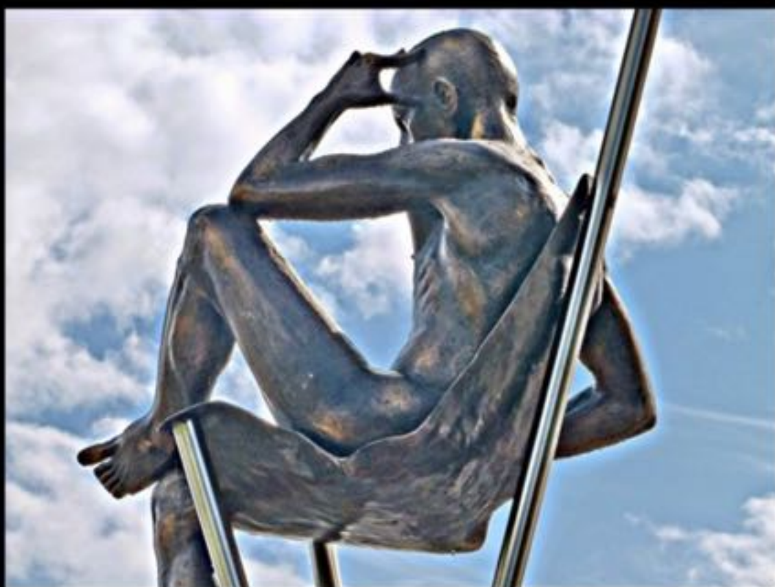
Grand Pensif (2012) 15: Unterseen, Spital