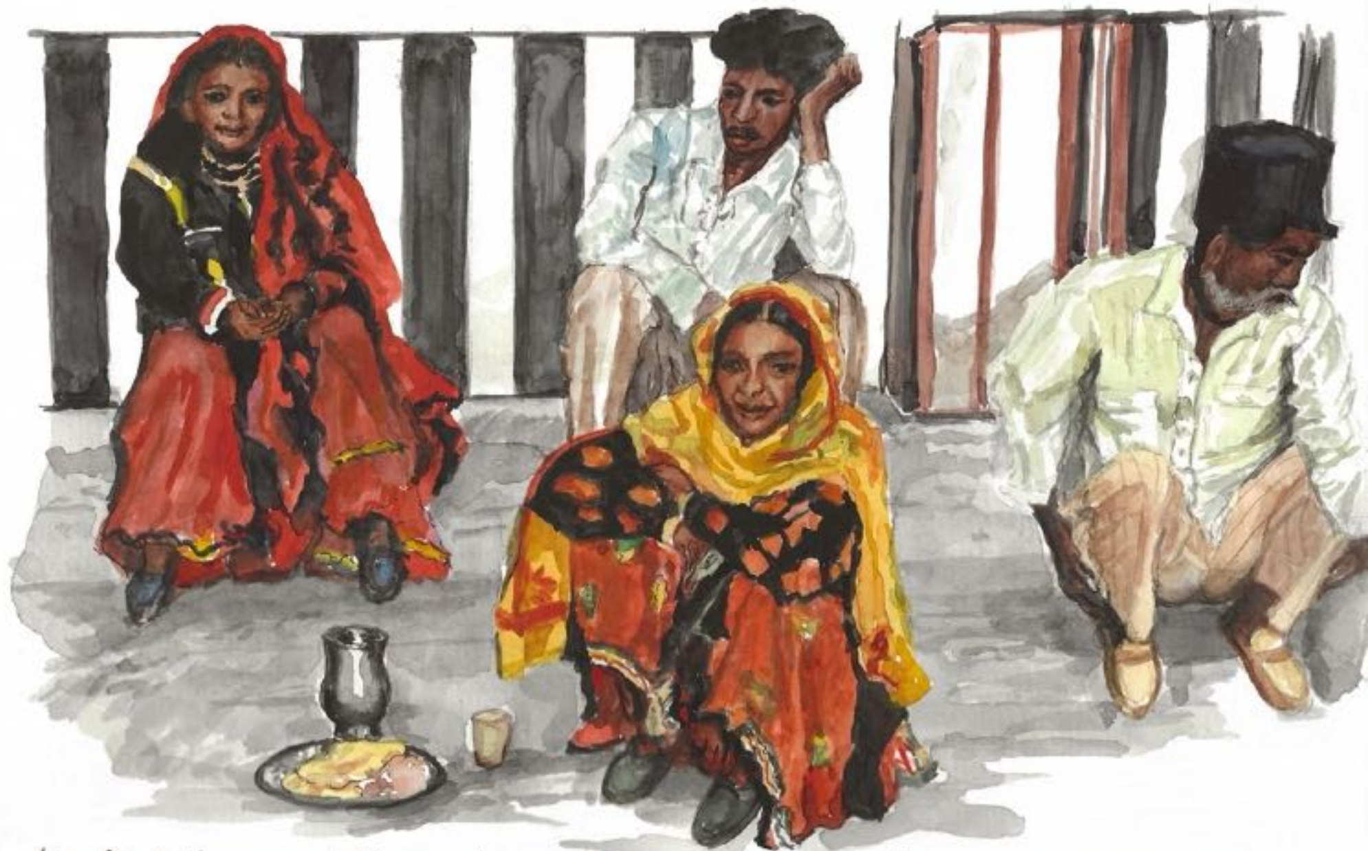
Une fête à l'occasion de l'inauguration d'un centre écologique rassemble au soir des comités himalayens Une foule colorée où se mêlent les ethnies.