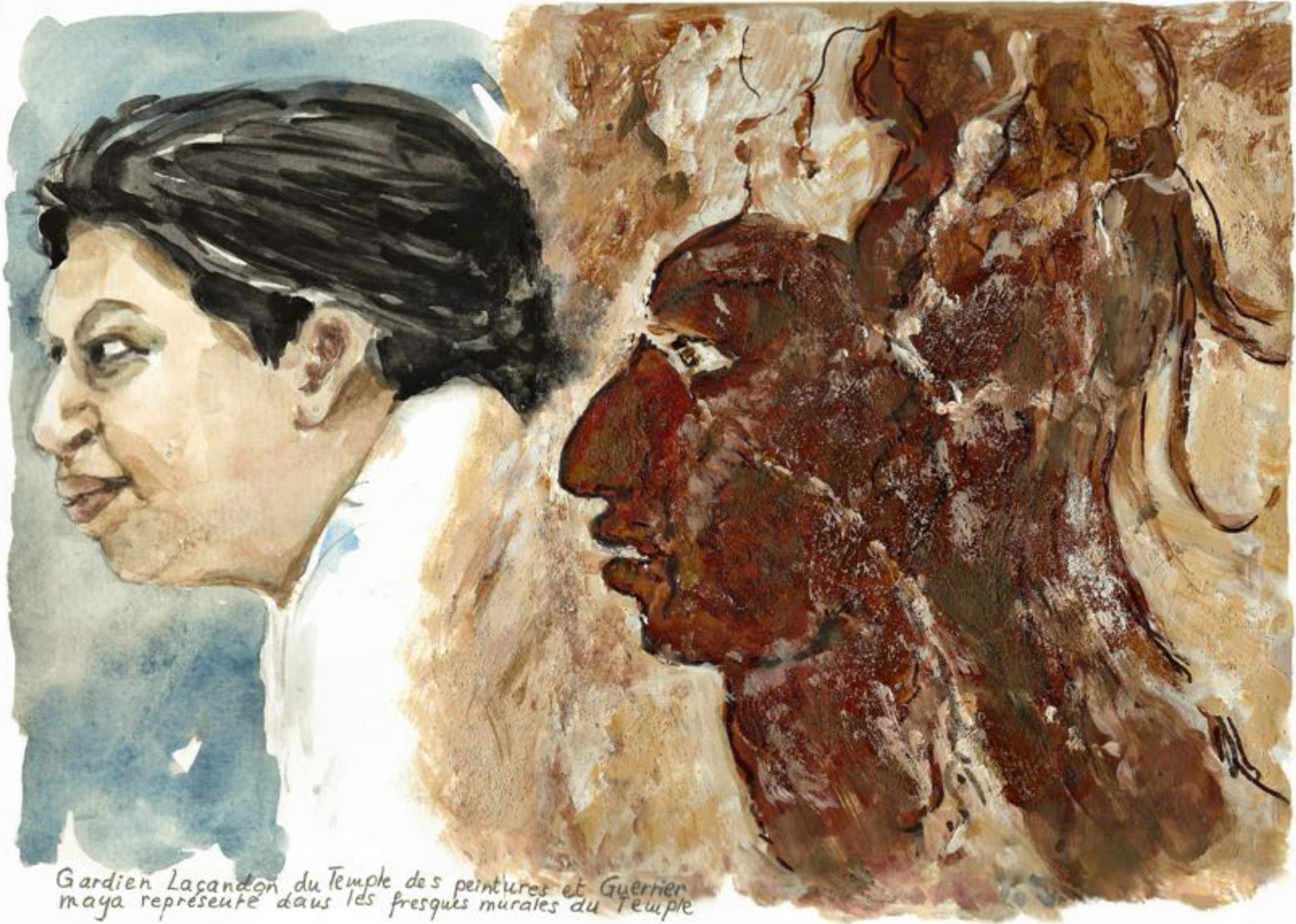
Gardien Lacandon du Temple des peintures et Guerrier maya représenté dans les fresques murales du Temple