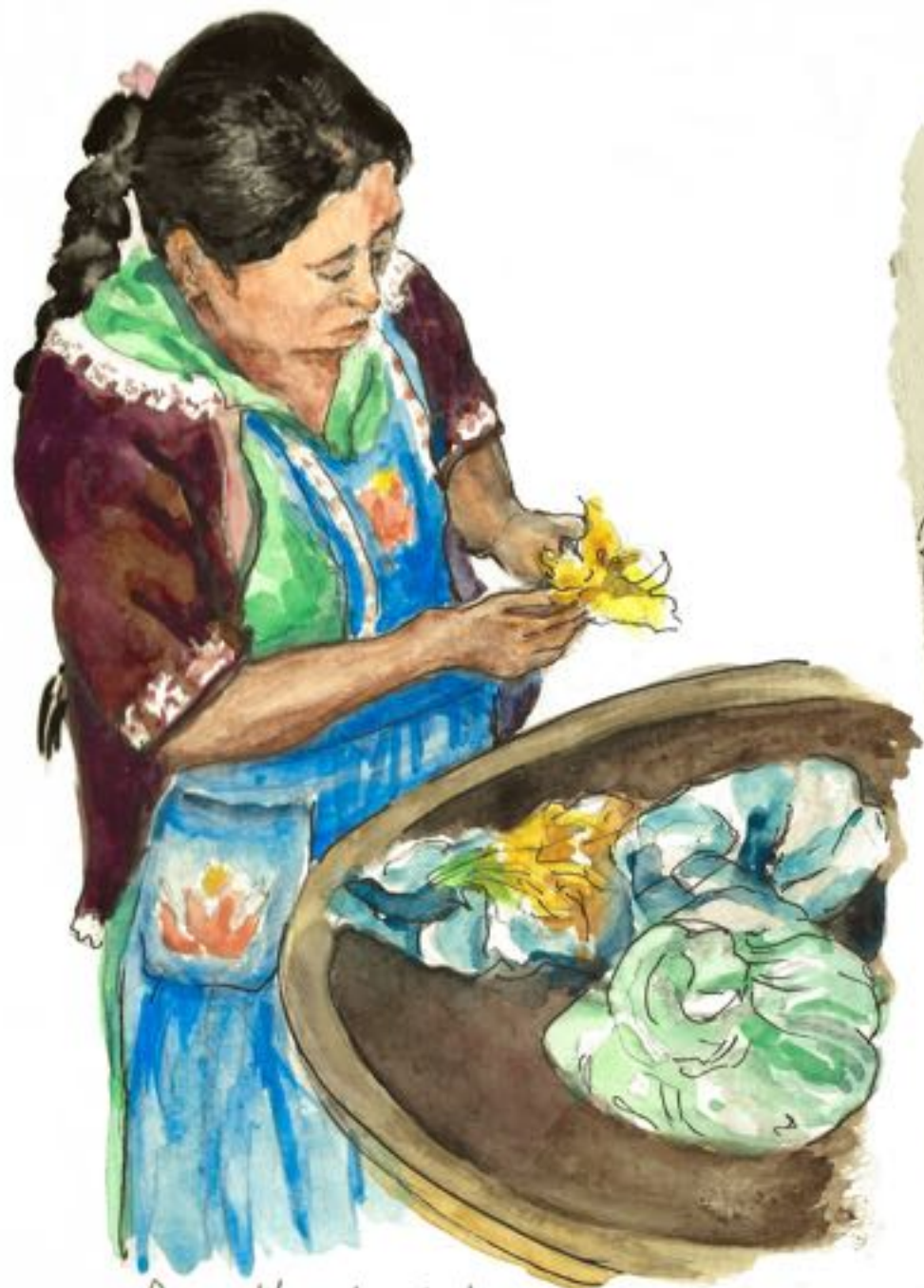
Au petit resto de bord de route on assiste à la préparation des tortillas fourrées ensuite de fleurs de courgettes avant que les tacos soient enroulés pour être servis