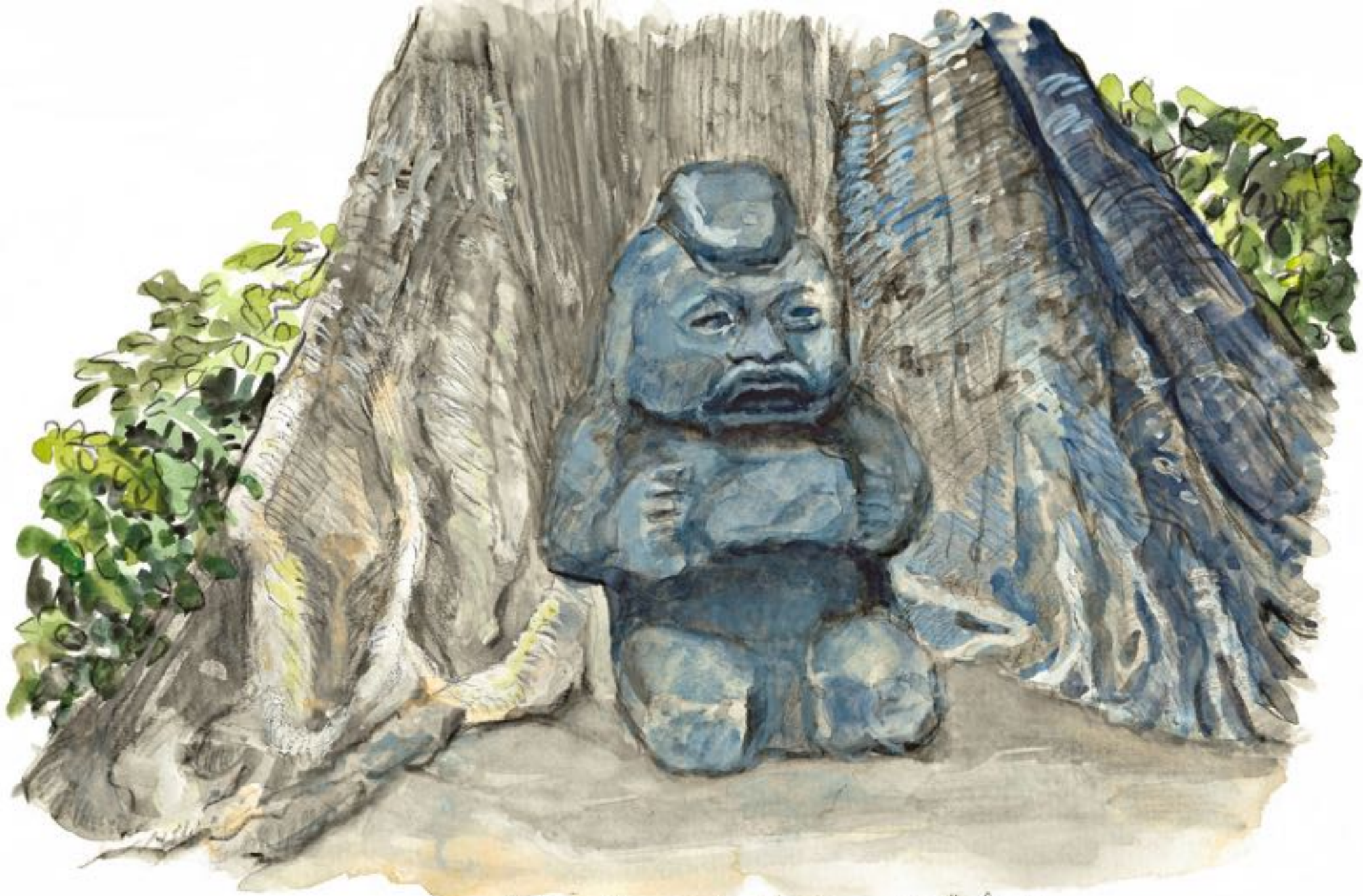
Petite statue de La Abuela, une vieille femme à genoux, portant ce qui est peut être un récipient destiné à recevoir des offrandes