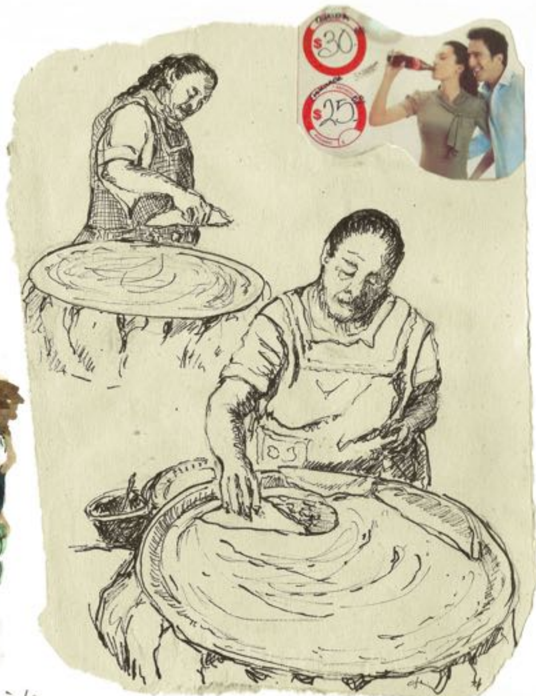
Un grand four surmonté d'une plaque où la pâte à tortilla est étalée