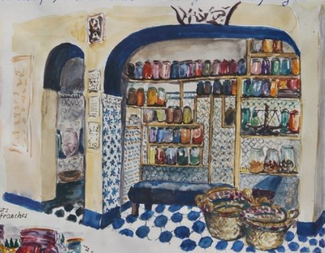
pigments aux couleurs franches

السبب في البرص والبقع تعدت الفيتامينات دورا هاما في وقاية الجسم من عدة امراض اذ يثابته كالتالي يري ودهاء الحفر والكساح والجلاش... وتدخل الفيتامينات بكميات هائلة للقيام بهذا الدور