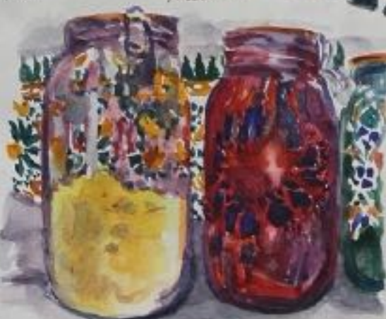
un monde de couleurs et de parfums