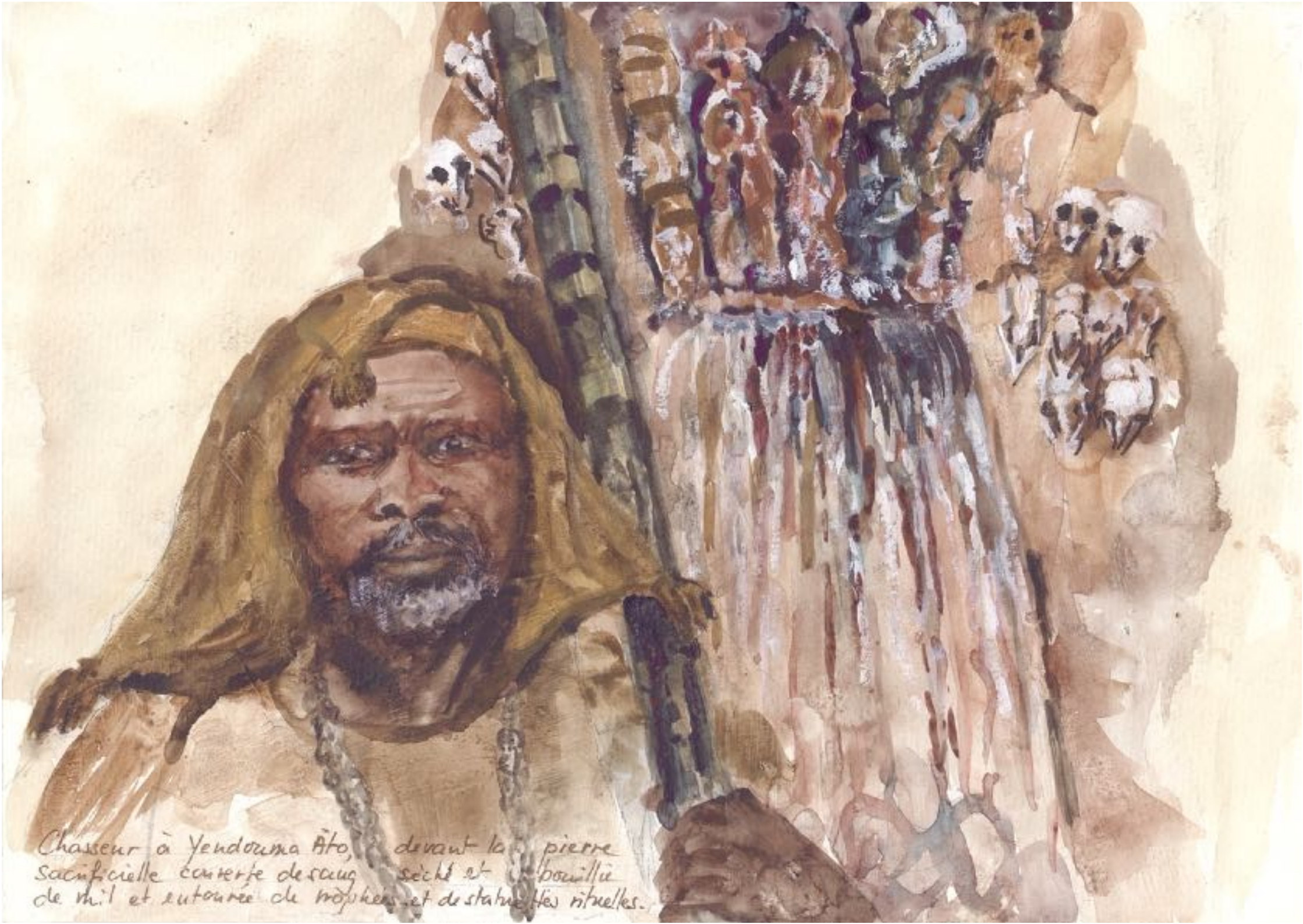
Chasseur à Yendouma Ato, devant la pierre sacrificielle conterie de sang séché et bouillie de mil et entourée de mûches et de statuettes rituelles.