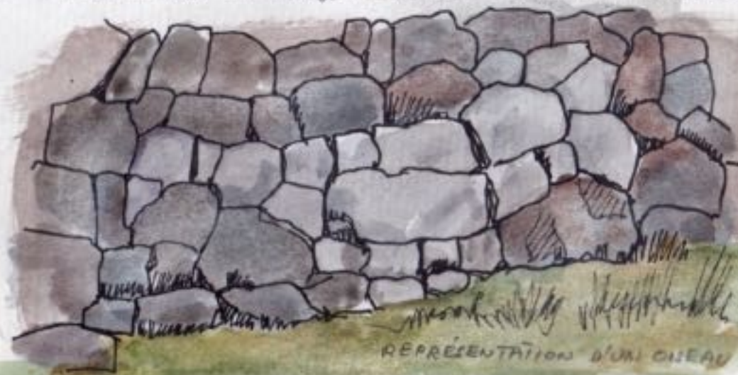
REPRÉSENTATION D'UN CHEVAL

LA BEAUTÉ TERRESTRE EST REPLÉTÉE DANS LA REPRÉSENTATION DES ESPRITS DE LA NATURE QUI, D'UNE MANIÈRE SUBLTILE ET INTÉRIEURE EST INTÉGRÉE DANS L'ASSEMBLAGE DES BLOCS. AINSI LES FIGURES QUI